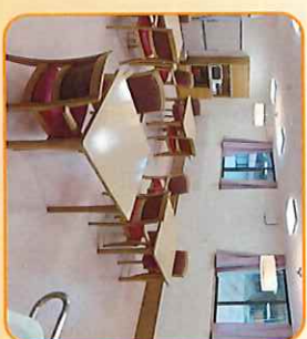
共同生活スペース

※ 介護保険からの給付額に変更があった場合、変更額に合わせて、入所者の負担額を変更します。 ※ 入所者がまた介護認定を受けていない場合は、サービス利用料金の全額をいったんお支払いいただけます。要介護認定を受けた後、自己負担額を除く金額の介護保険から払い戻されます (償還払い)。償還払いとなる場合、入所者が保険給付の申請を行うために必要となる事項を記載した「サービス提供証明書」を交付します。 ※ 下記の「その他の加算」は個別に算定されたものを別途徴収させていただきます。 ※ 介護保険適用の場合でも、保険料の滞納等により、事業者にご依頼介護保険給付が行われずにお支払いとなります。その場合、料金の利用料金全額をお支払いください。利用料のお支払い引き換えに「サービス提供証明書」と「領収書」を発行します。「サービス提供証明書」と「領収書」は、後に利用料の償還払いを受ける時に必要となります。