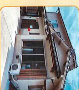
デイサービスセンター友の里