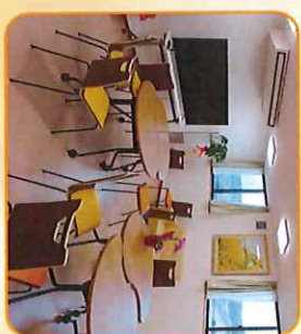
共同生活スペース